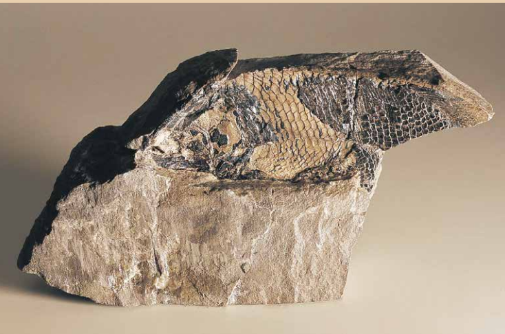
Fossile su Bellerophon, 250 MA | Versteinering auf Bellerophon, 250 MJ

“A quale atto della creazione, a quale capriccio della natura le Dolomiti devono l'incredibile molteplicità di forme e di colori che avvince i nostri occhi meravigliati e ne costituisce il fascino inconfondibile?” A questa domanda il Museo risponde con la più ricca collezione scientifica sulle Dolomiti occidentali in Alto Adige. Bellissimi fossili di piante e animali terrestri e marini documentano l'evoluzione e il processo formativo delle montagne dolomitiche nell'arco di 250 milioni di anni.