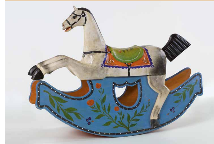
Cavallo a dondolo | Schaukelpferd, 1900

Uno dei tesori del Museo sono gli antichi giocattoli in legno collezionati da Giovanni Senoner Vastlé. Bambole snodabili, cavalli a dondolo, burattini etc. ci riportano ai giochi semplici della nostra infanzia e alla fantasia che li circondava. Sono stati creati dal 1700 al 1940 da intere famiglie unite attorno al tavolo di lavoro nelle loro umili stube e in seguito esportati in tutta Europa.