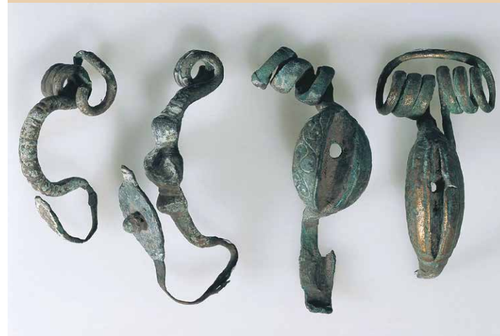
Fibule in bronzo | Bronzefibeln, Col de Flam, 3.-1. sec. a.C.

Di notevole rilevanza storico-culturale è la serie di preistorici manufatti litici di selce ritrovati al Plan de Frea (Passo Gardena) e di oggetti appartenenti all'età del ferro rinvenuti al Col de Flam presso Ortisei; tra questi si conservano fibule, anelli, spade e attrezzi da lavoro di considerevole fattura. Eccezionale è il ritrovamento del “Pugnale del Balèst” risalente all'età del bronzo.