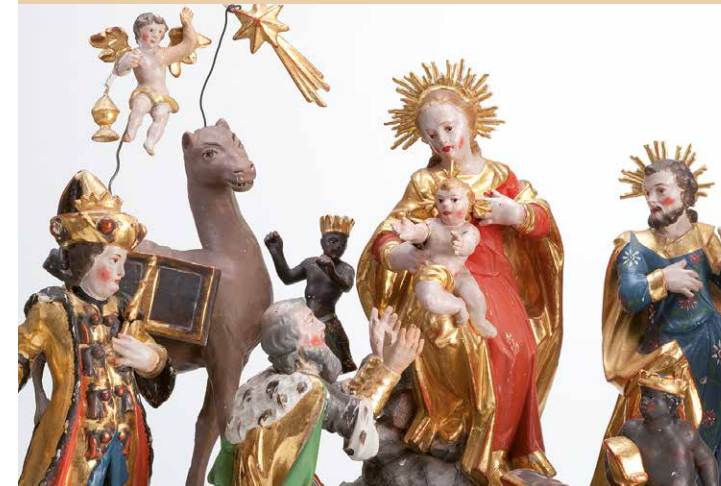
Scuola Vinazer | Vinazer-Schule, 1750

Una vasta raccolta di sculture sacre e profane consente di conoscere la tradizione e l'evoluzione della scultura lignea della Val Gardena negli ultimi quattro secoli. Vi si ammirano le figure religiose attribuite agli scultori barocchi Trebinger e Vinazer, di cui si conservano gli originali dell'antica chiesa di San Giacomo, nonché le opere degli artisti della metà del XX secolo.