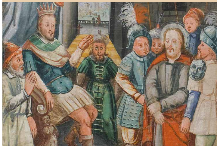
Particolare | Detail, 1620/30