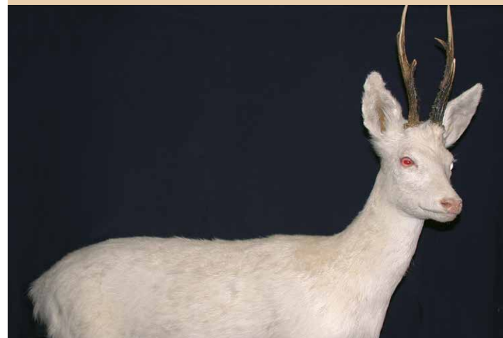
Capriolo albino | Weißer Rehbock

L Museum pieta n cheder senificatif dla storia y cultura de Gherdëina y fej udëi la truepa richëzes de si natura y la criaziions artistiches de si jënt. De marueia ie la bela culezion de mine-rai, curëc y füssi che conta dla storia faszinënta dla furmazion geologica dla Dolomites. Reperc archeologics lascia udëi la plu vedla prejënza dla persona preustorica dala Mont de Sëuc y Scilier nchin sun i jëufs de Frea y Sela. Scultura sacra y ert profana ie documënc de gran valor dl ert dl ziplé de Gherdëina, dai prim