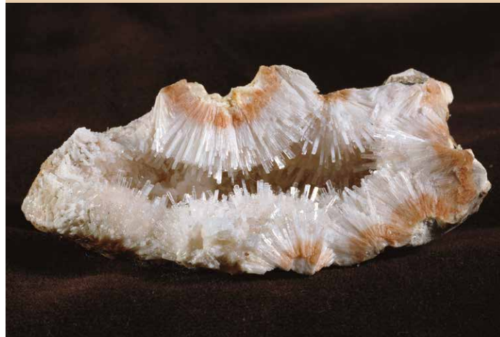
Natrolit/e, Piz Sella