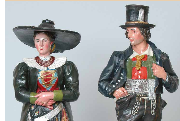
Coppia in costume gardenese | Grödner Trachtenpaar, 1900

Nella ricchissima collezione di minute sculture profane vi è espressa l'umoristica creatività degli artisti o semplici artigiani gardenesi dei secc. XVII-XIX. Una particolare menzione va ai presepi, composti all'inizio del XVIII sec. soltanto da poche figure, poi sempre più ricchi e completi.